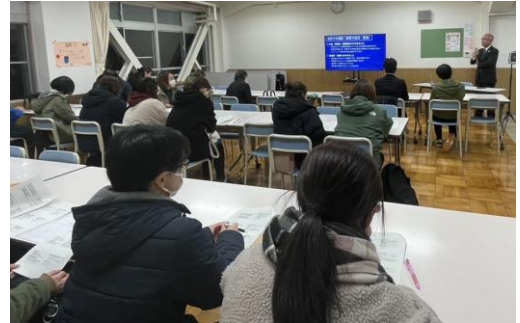
対面でも大勢参加していただきました！

新潟市内の中学校全体で、部活動の地域移行に向けた準備が少しずつはありますが進んできています。既に先行実施している学校も含め、令和8年度に完全実施できるよう、学校や地域の実情に合わせて準備が行われています。